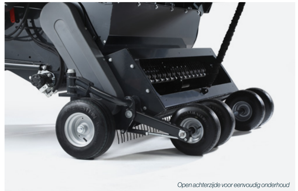
Open achterzijde voor eenvoudig onderhoud