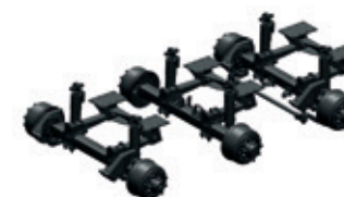
40 tons hydraulisch geveerd gedwongen gestuurd tridem