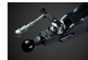
Elektrische sturing. Standaard op 7200 en 8400+ modellen. Optioneel op andere modellen.