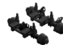
30 tons hydraulisch geveerd gedwongen gestuurd tandem