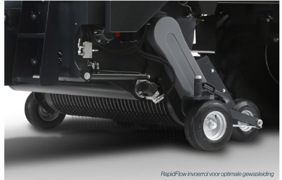
RapidFlow invoerrol voor optimale gewasleiding

De combinatie van de unieke eigenschappen van ons concept met de Schuitemaker Trailing pick-up, de RapidFlow invoerrol en de krachtige soepele PowerRotor, maken het oprapen nog makkelijker, zuiniger en efficiënter dan ooit tevoren. Zo bereikt u moeiteloos het optimale resultaat.