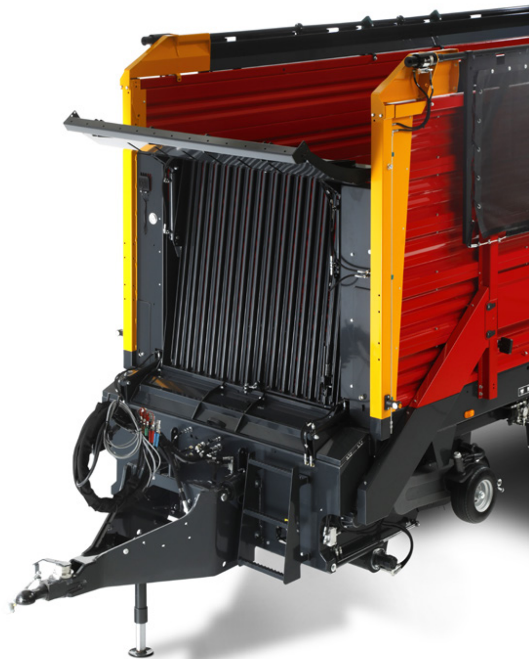
Rapid Stream voorbord in oogstpositie maissilage

Dankzij het Schuitemaker Rapid Stream hydraulisch voorbord kent de Schuitemaker Rapide een optimale gewasstroom. Doordat het voorbord in verschillende posities is te zetten is de Schuitemaker Rapide veelzijdig inzetbaar in zowel de gras- als maisoogst.