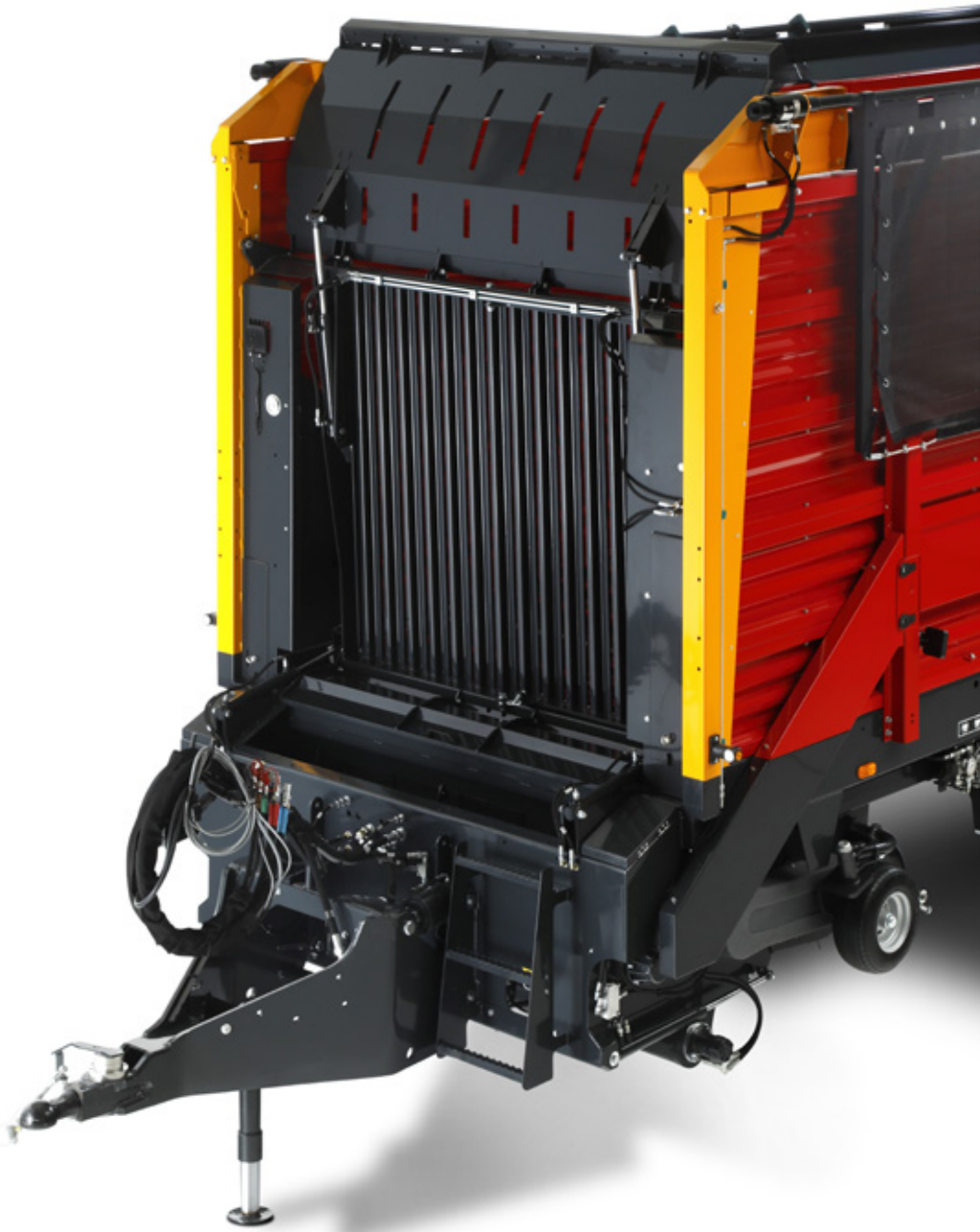
Rapid Release lospositie voorbord