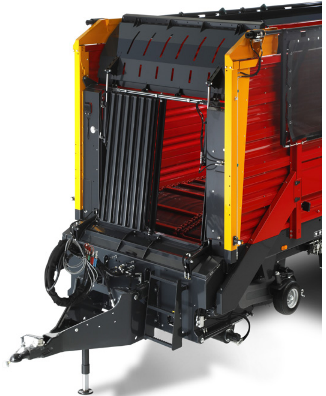
Toegangsdeur voor inspectie en onderhoud.