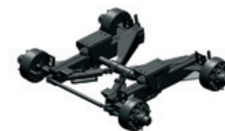
24 tons meelopend gestuurd tandem

Alle gegevens zijn zo zorgvuldig mogelijk opgesteld, doch niet bindend. Wijzigingen in constructie/uitvoering zijn altijd mogelijk.